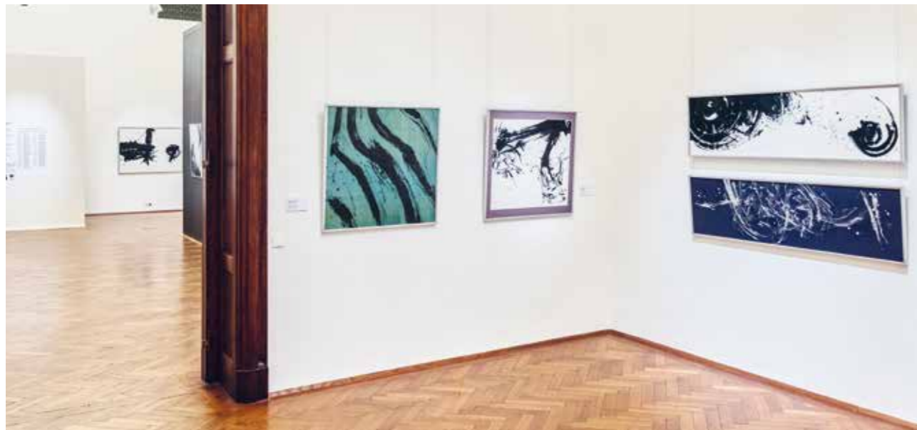
Ausstellungsansicht von Beyond the Future Moderne japanische Kalligrafie

In der avantgardistischen Kalligrafie, deren zeitgenössischer Ausprägung Sie in dieser Ausstellung begegnen, verläuft der Übergang von Schrift zu Kunst fließend.