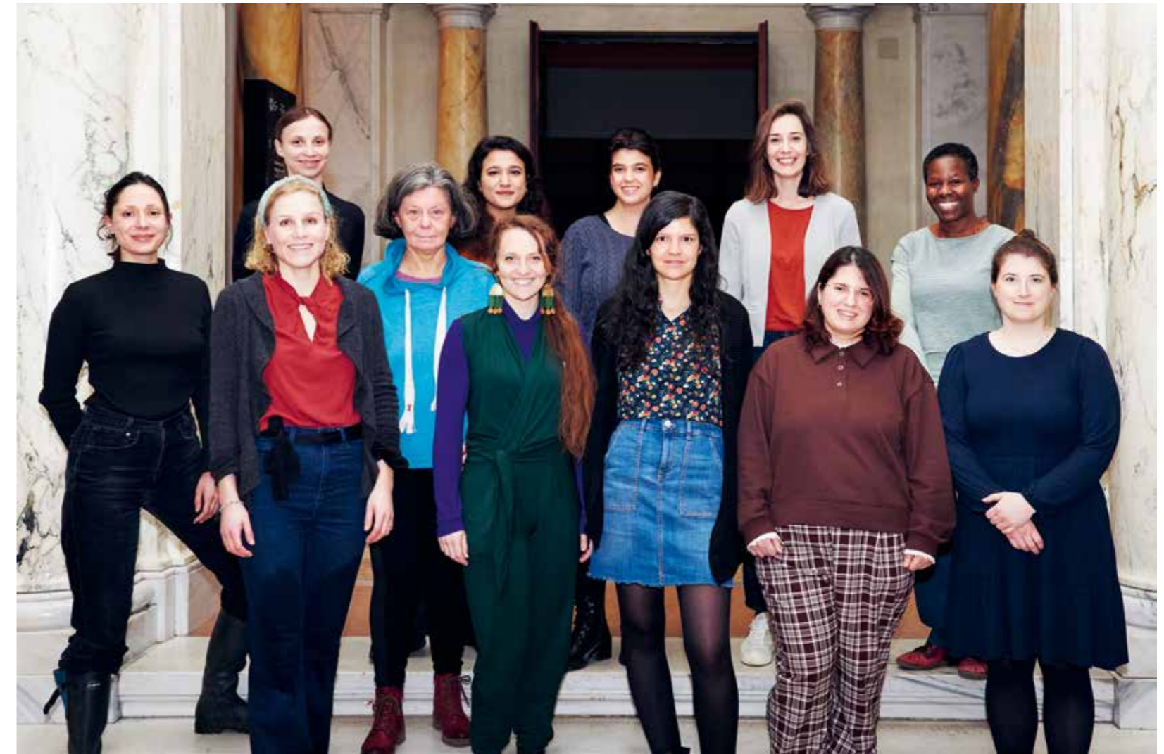
Team der Kulturvermittlung

Neu am Programm steht außerdem der Deep Dive Donnerstag, indem unsere Expert*innen aus dem kuratorischen und dem konservatorischen Team