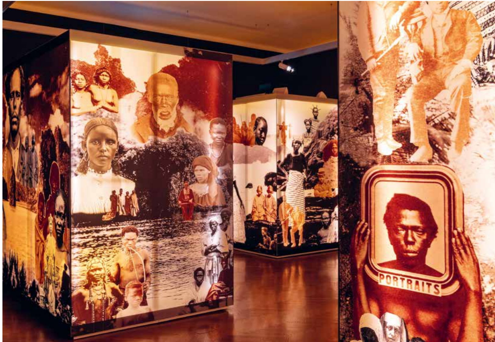
Ausstellungsansicht von Whatever You Throw at the Sea... Zara Julius