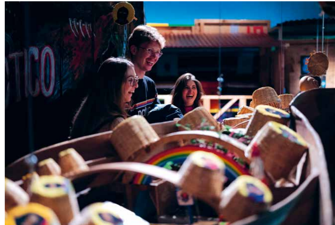
Eröffnung der Ausstellung Science Fiction(s) Wenn es ein Morgen gäbe