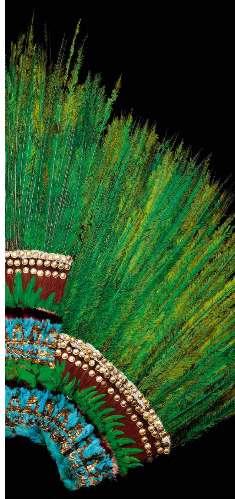
Cover: Federbüste des Kriegsgottes Ku, Hawaii (18. Jh.) Links: Der Saal „Sammlerwahn. Ich leide an Museomanie!“ Mitte: Altmexikanischer Federkopfschmuck, Mexiko (16. Jh.) Rechts: Buddhafigur, USA (21. Jh.)

vor, zwischen oder nach Ihrem Museumsbesuch mit viel Liebe kulinarisch verwöhnen. Weitere Informationen inkl. dem Menü erhalten Sie unter www.cook-bistro.at .